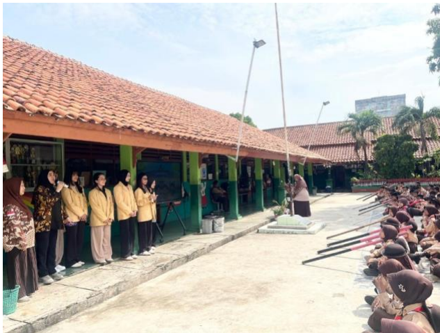
Gambar 2. Kegiatan Seremonial Pembukaan oleh Dosen dan Mahasiswa Mata Kuliah Strategi Lobi Ubhara Jaya di SDN Sepanjang Jaya III Bekasi

Kegiatan ini diharapkan dapat memberikan pemahaman kepada siswa-siswi mengenai pentingnya komunikasi bijak melalui tutur kata dan perilaku yang sopan dan santun, sikap saling menghargai dan menghormati, serta bagaimana cara menghindari perilaku perundungan ( bullying ) dalam interaksi sosial di lingkungan sekolah. Terlihat pada gambar di bawah ini.