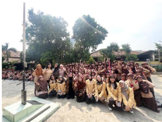
Gambar 3: Kegiatan Dokumentasi Bersama Tim Pelaksana, Guru, dan Siswa-Siswi

Sebagai penutup kegiatan, seluruh tim pelaksana bersama para siswa-siswi dan guru SDN Sepanjang Jaya III melakukan sesi dokumentasi bersama sebagai bentuk apresiasi dan kenang-kenangan atas terselenggaranya kegiatan Pengabdian kepada Masyarakat tersebut. Sesi dokumentasi dilakukan dengan penuh antusias dan suasana yang hangat, di mana para siswa-siswi terlihat aktif, ceria, dan bersemangat setelah mengikuti rangkaian kegiatan sosialisasi. Kegiatan dokumentasi ini juga menjadi simbol terjalannya hubungan yang baik antara pihak sekolah dengan tim pelaksana dari Program Studi Ilmu Komunikasi Universitas Bhayangkara Jakarta Raya. Terlihat pada gambar di bawah ini.