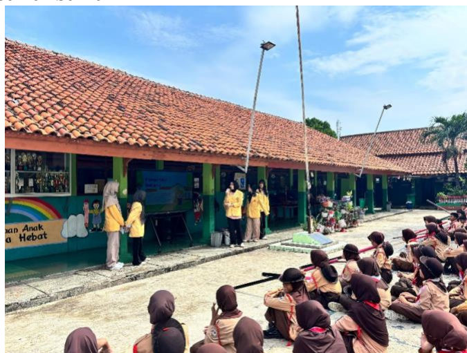
Gambar 3. Kegiatan Penyampaian Materi Komunikasi yang Bijak pada Siswa-Siswi di SDN Sepanjang Jaya III Bekasi

Pada sesi penyampaian materi, kegiatan diawali dengan pemaparan mengenai pentingnya komunikasi yang bijak dalam kehidupan sehari-hari di lingkungan sekolah. Materi ini menjelaskan bahwa komunikasi yang bijak tidak hanya berkaitan dengan kemampuan berbicara, tetapi juga mencakup kemampuan memahami perasaan orang lain, menghargai perbedaan, serta membangun interaksi yang saling menghormati. Terlihat pada gambar di bawah ini.