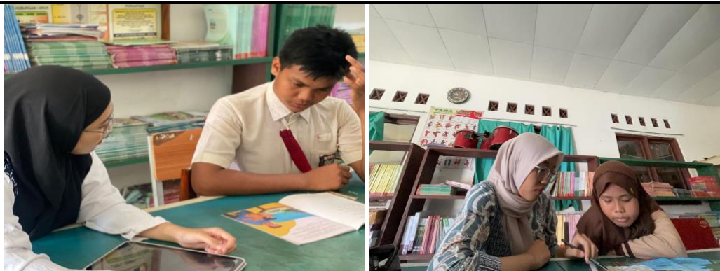
Gambar 3: Kegiatan Pendampingan Membaca Kelas 6 dan Kelas 3

Pendekatan scaffolding multilevel yang kami terapkan dari bantuan maksimal hingga mandiri — terbukti efektif sesuai zona perkembangan proksimal siswa (Nabila et al., 2025). Penggunaan lagu phonics , flashcard , dan lembar kerja bertahap juga mempercepat pengenalan huruf dan suku kata secara menyenangkan (Alisa Hildayanti et al., 2023). Respon orang tua yang meminta les lanjutan di rumah menjadi bukti nyata bahwa program ini tidak hanya berdampak pada anak, tetapi juga menggugah kesadaran literasi keluarga di kawasan perkebunan (Purnama et al., 2025).