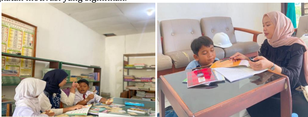
Gambar 1: Pendampingan Membaca Menggunakan Flashcard dan Bimbel di Rumah

Berdasarkan Tabel 1 dan Grafik 1, seluruh siswa mengalami kenaikan level membaca dengan rata-rata +3,1 tingkat hanya dalam delapan minggu. Tidak ada lagi siswa di level 1. Siswa dengan hambatan belajar lambat (MF) berhasil naik dari level 3 menjadi level 6. Temuan ini sejalan dengan (Nensy Auliyatul Hidayah 1 , Mohammad Afifulloh 2 , 2021) bahwa pendampingan individu yang konsisten dengan media sederhana mampu meningkatkan kemampuan membaca siswa dari level dasar menjadi lancar disertai peningkatan motivasi yang signifikan.