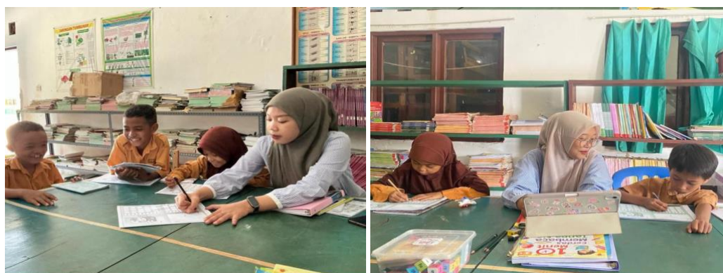
Gambar 2: Kegiatan Pendampingan Membaca Kelas 2