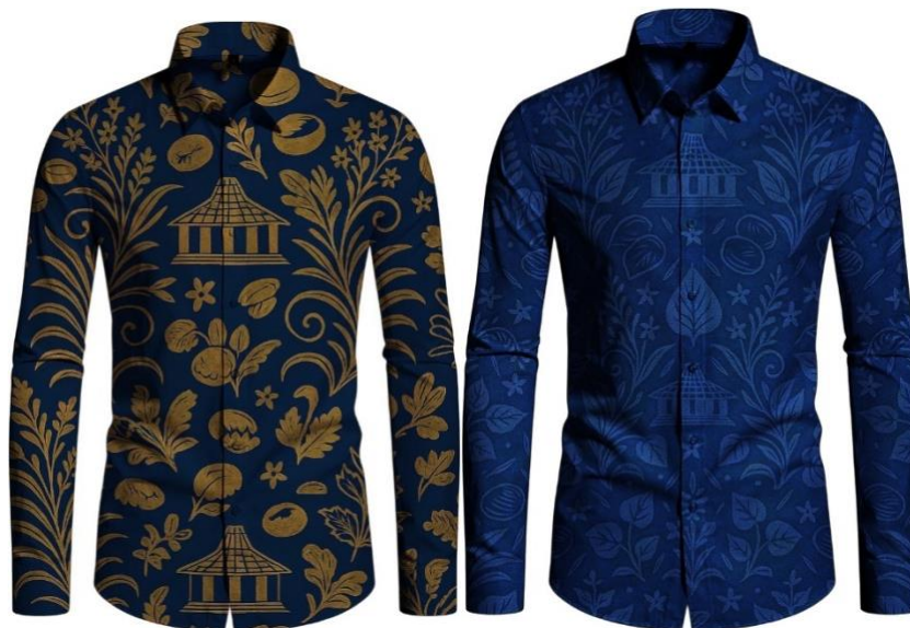
Gambar 3: Kegiatan Mock Up Desain di Kemeja

Penyesuaian proses dilakukan untuk memastikan desain yang dibuat memenuhi persyaratan fungsional, teknis, dan estetika. Dimulai dengan menilai desain dengan masukan dari perangkat desa, ahli batik, atau rekan desainer. Untuk membuat hasil akhir lebih teratur dan mudah dipahami, detail seperti penyempurnaan bentuk, garis, dan proporsi motif dilakukan. Untuk memastikan bagaimana motif akan terlihat saat diaplikasikan, dibuat mock up untuk meniru motif secara visual pada media kain setelah revisi selesai. Ini dilakukan dalam bentuk digital. Terlepas dari kenyataan bahwa proses ini tidak berlanjut hingga tahap produksi kain yang sebenarnya, hasil mock up tersebut merupakan gambaran desain akhir yang siap digunakan saat proses produksi dimulai.