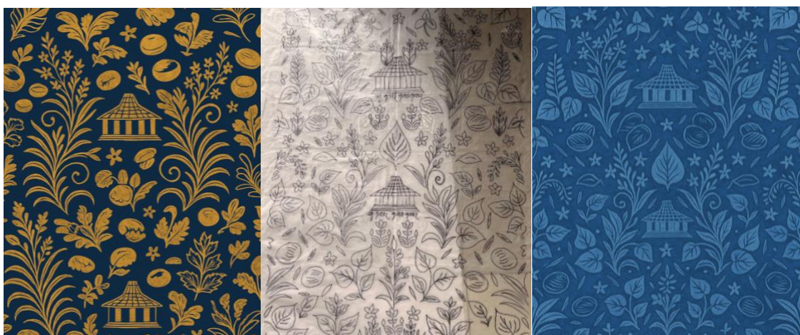
Gambar 2: Kegiatan Desain Batik Manual dan Digital

Sketsa yang dihasilkan kemudian menjalani proses pengembangan yang lebih panjang untuk menciptakan desain batik khas yang harmonis secara visual. Sketsa yang dihasilkan kemudian menjalani proses pengembangan yang lebih panjang untuk menciptakan desain batik khas yang harmonis secara visual. Pengaturan komposisi, irama, dan campuran motif dilakukan dengan menyeimbangkan faktor-faktor seperti estetika, unsur-unsur filosofis yang terkandung dalam motif, dan kesesuaian desain dengan media kain yang akan digunakan. menyeimbangkan faktor-faktor penting seperti estetika, unsur-unsur filosofis yang terkandung dalam motif, dan kesesuaian desain dengan media kain yang akan digunakan. berfungsi sebagai komponen penting karena, selain meningkatkan kualitas artistik, warna memiliki nilai simbolis dalam meningkatkan identitas budaya. Pada titik ini, beberapa alternatif juga dibuat.